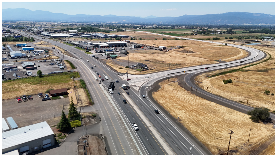
Intersección de la OR 62 Expressway y Crater Lake Highway

Esta iniciativa de planificación se centra en el área de la comunidad de White City y sus alrededores.